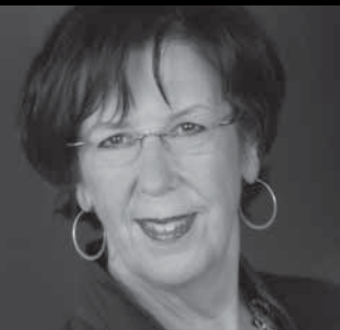
Annemarie Jorritsma burgemeester gemeente Almere

Graag vernemen wij of we op uw komst mogen rekenen. Wij verzoeken u vriendelijk ons daarvan per e-mail op de hoogte te brengen. In verband met het beperkt aantal plaatsen is aanmelding vooraf noodzakelijk. Na aanmelding proberen wij u zo snel mogelijk een bevestiging van uw plaatsing te sturen.